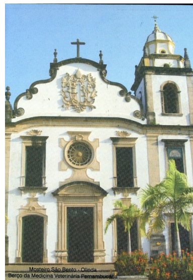
Fig.1 - Erste Tierklinik in Brasilien - 1916 - Tierärztliche Hochschule São Paulo Fig.2 Kloster St. Benedikt - Die Brüder Benediktiner entwickelten die Tierärztliche Hochschule in Brasilien.